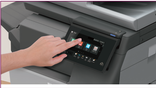
Sharpin palkittu käyttöliittymä - kehitetty helpottamaan elämää.

Sharpin laitteissa on LCD-pyyhkäisyinäytöllä varustettu käyttöpaneeli sekä palkittu helppokäyttöliittymä*, jonka avulla luot intuitiivisen näytön ja saat helposti käyttöösi yleisimmät toiminnot. Voit myös räätälöidä käyttöpaneelin omaan toimintatapaasi sopivaksi valikon kuvakkeita vetämällä ja pudottamalla.