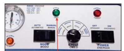
Luz de ciclo