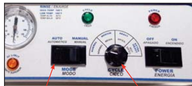
Ajuste "Automatic" (Automático) Configuración de ciclos