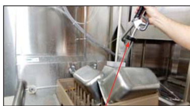
Manguera de pre-enjuague