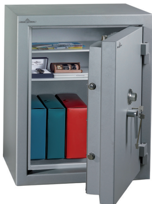
Modelo Zephyr Duo 4101