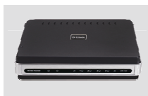
DIR-120 Ethernet Broadband Router

Если что-либо из содержимого отсутствует, пожалуйста, обратитесь к поставщику.