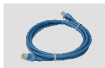
Кабель Ethernet (CAT5)UTP