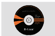
Компакт-диск (Мастер по быстрой установке маршрутизатора и руководство пользователя)