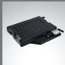
2º almacenamiento en bahía multimedia