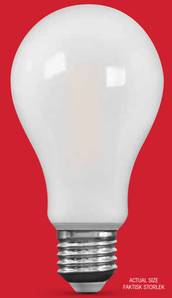
ACTUAL SIZE FAKTSISK STORLEK