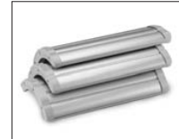
Three unique 'Chill Cells'™

Designed for use outdoors, simply insert 7 AA batteries.