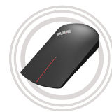
Souris tactile sans fil pour ThinkPad® X1