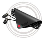
Écouteurs intra-auriculaires pour ThinkPad® X1