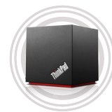
Station d'accueil WiGig ThinkPad®