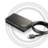
Station d'accueil ThinkPad® OneLink+