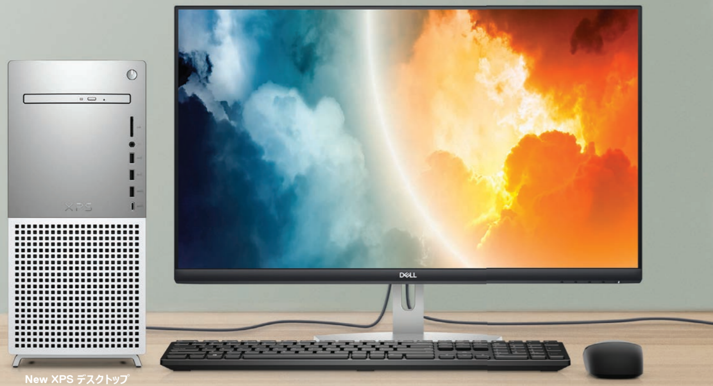
New XPS デスクトップ