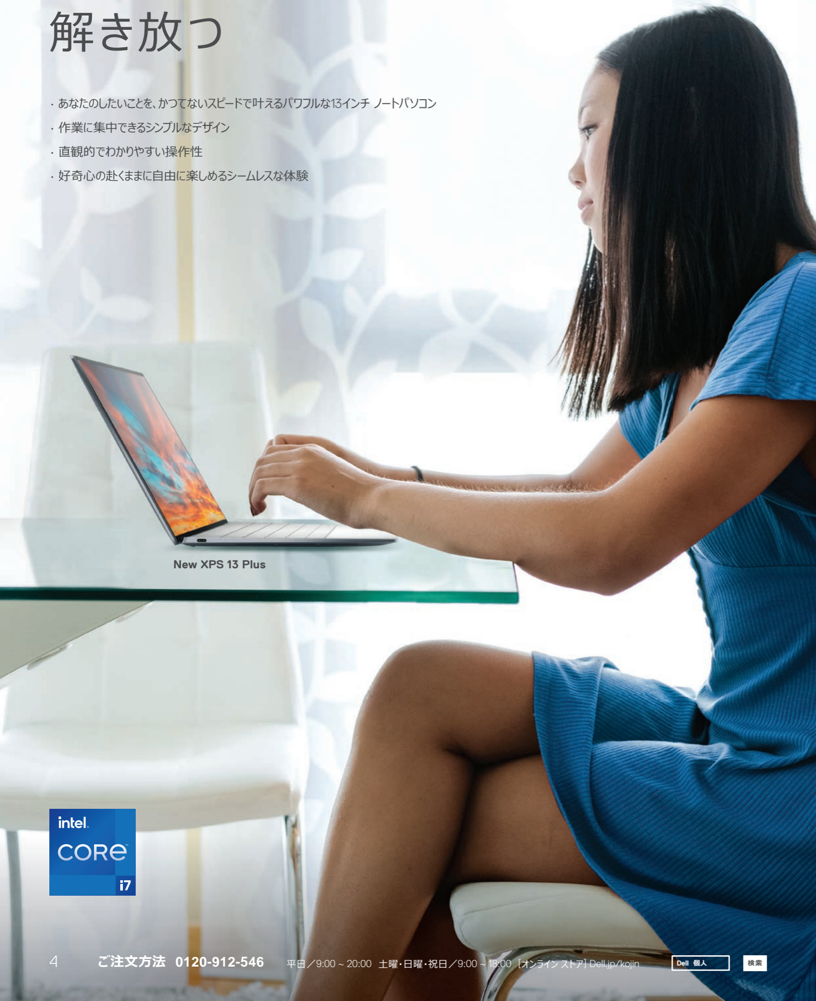
New XPS 13 Plus