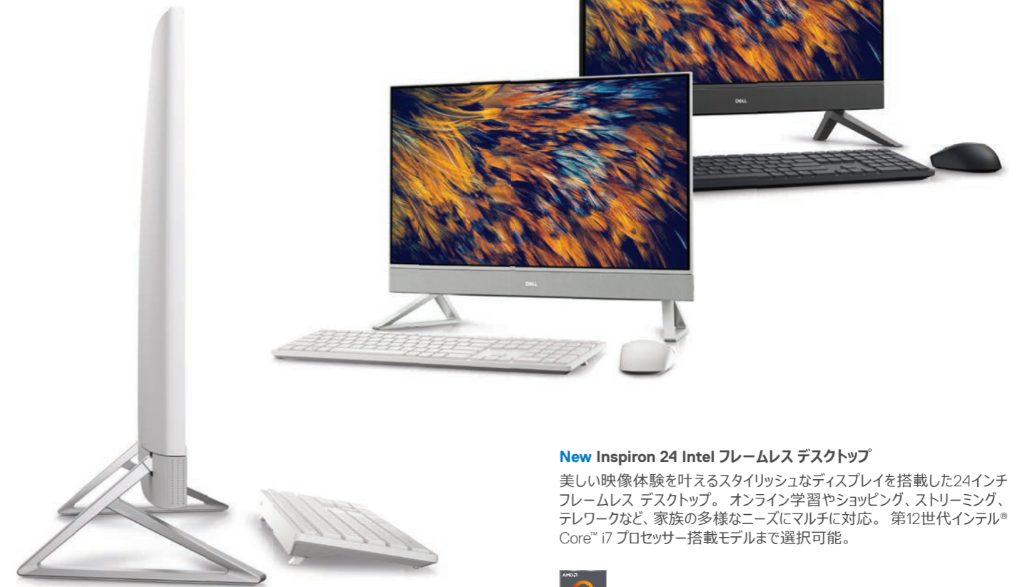
New Inspiron 24 Intel フレームレス デスクトップ

美しい映像体験を叶えるスタイリッシュなディスプレイを搭載した24インチフレームレス デスクトップ。オンライン学習やショッピング、ストリーミング、テレワークなど、家族の多様なニーズにマルチに対応。第12世代インテル® Core™ i7 プロセッサ搭載モデルまで選択可能。