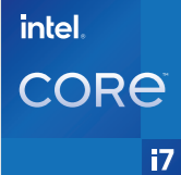
New XPS 13 Plus