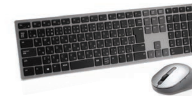
Dell プレミアワイヤレスキーボード/マウス KM7321W

2.4GHzのワイヤレスとBluetooth 5.0のデュアルモード接続対応で、お好みのモードでほとんどのPCとペアリングできるワイヤレス マウス。