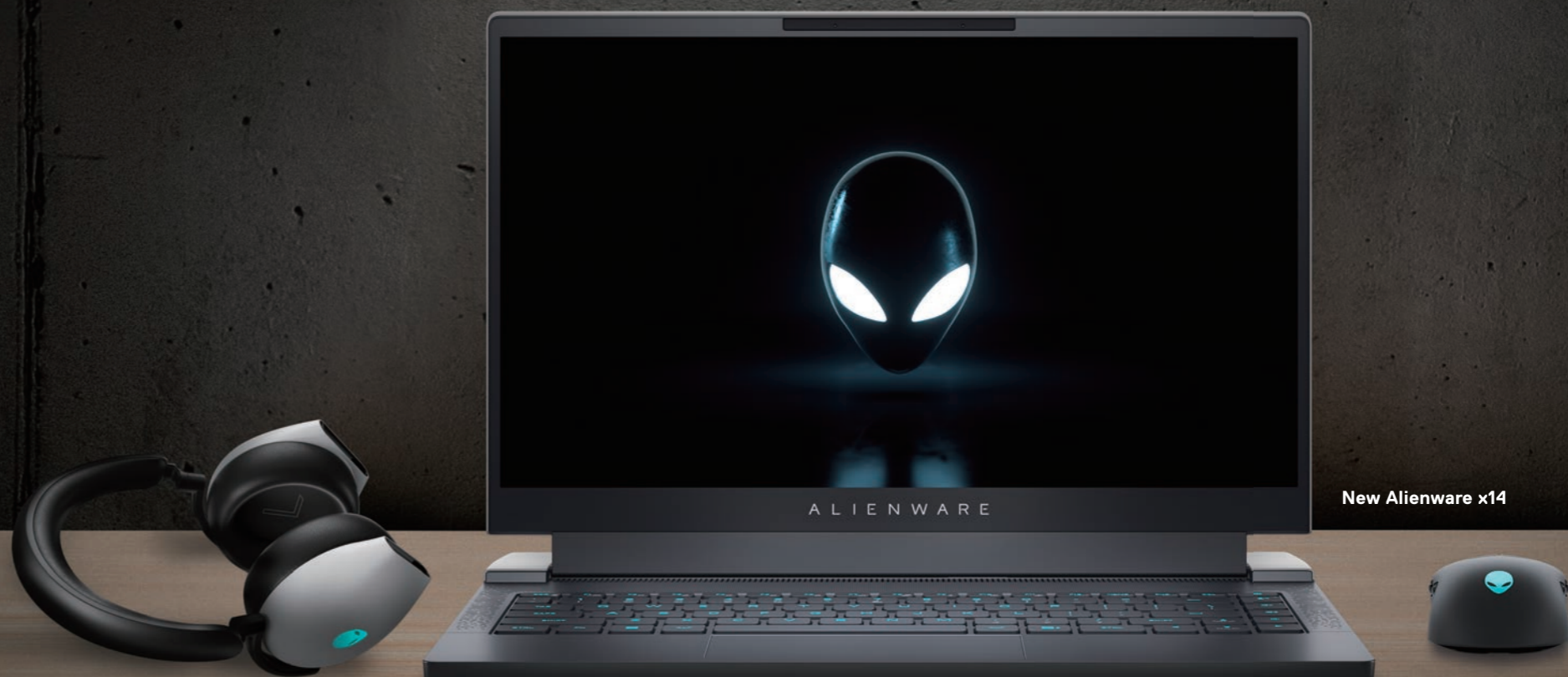
New Alienware x14