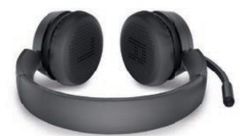
Dell Pro ワイヤレス ヘッドセット WL5022

様々な利用環境にマッチするデザインと安定したワイヤレス接続が作業環境を整えてくれるワイヤレス キーボード マウス。