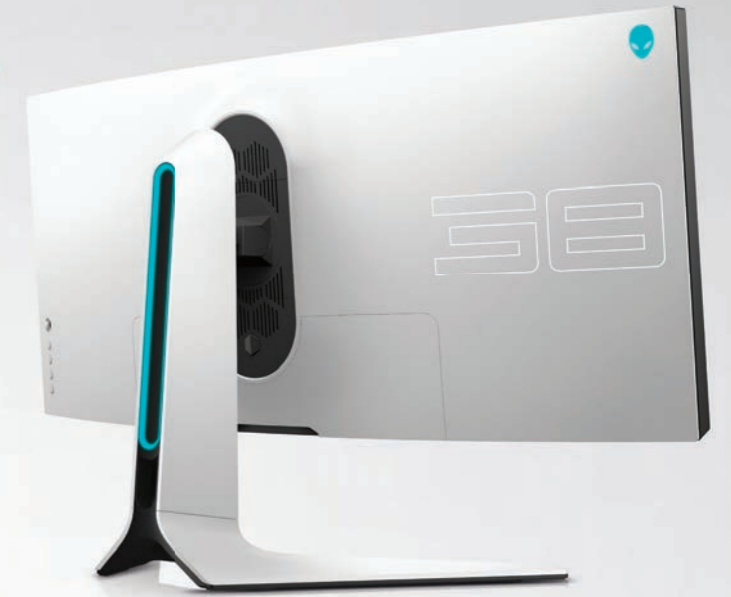
Dell Alienware AW3821DW 37.5インチ 曲面ゲーミングモニター VESA DisplayHDR™ 600対応 WQHD+の高解像度に加え、包み込まれるような曲面デザインがゲームプレイに更なる臨場感を与える37.5インチゲーミングモニター。