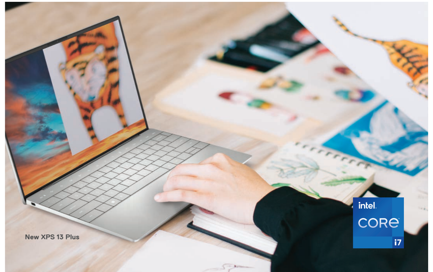
New XPS 13 Plus