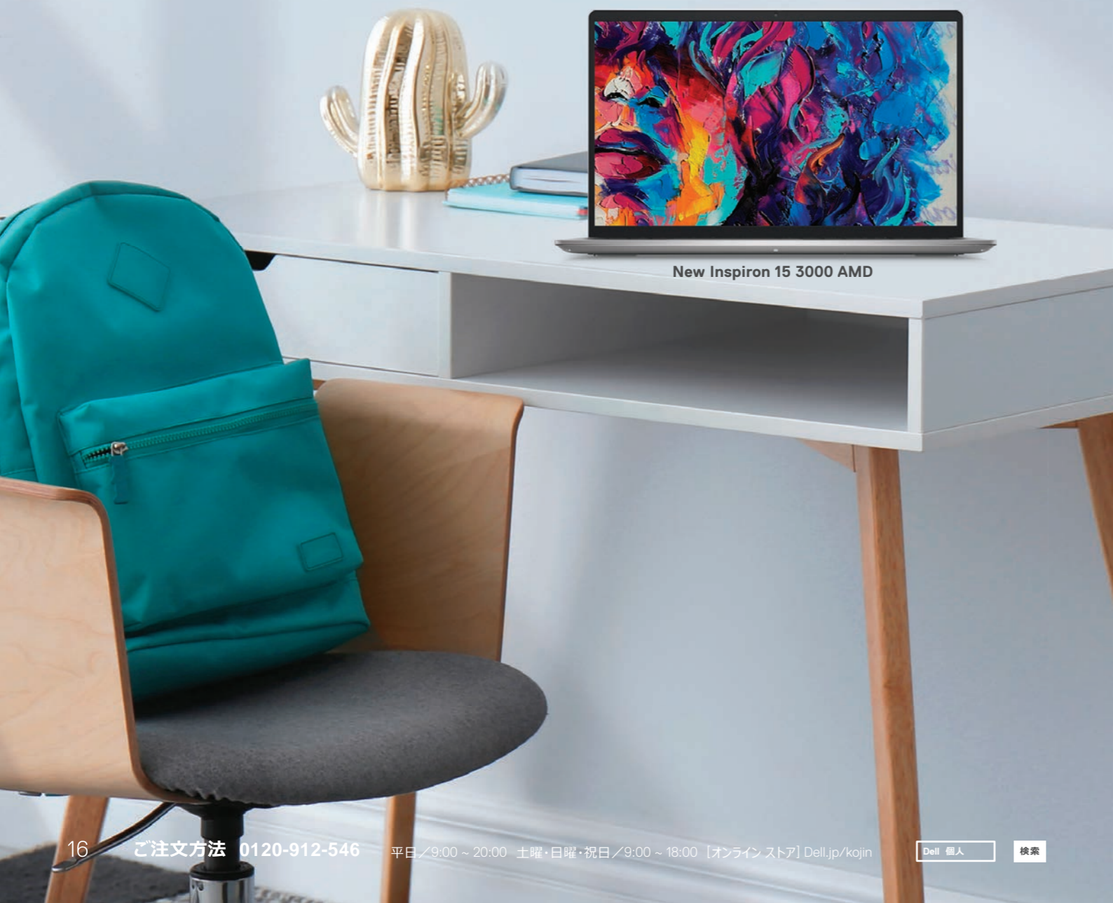
New Inspiron 15 3000 AMD