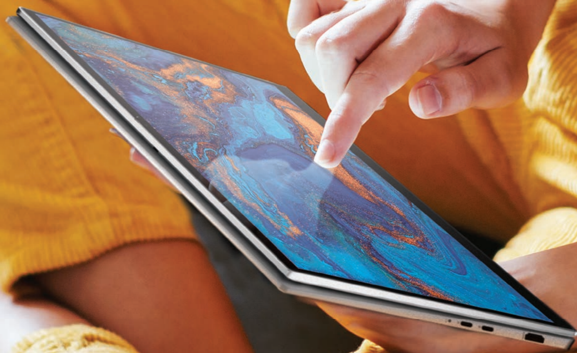
New Inspiron 14 2-in-1 Intel