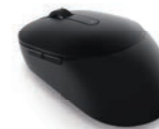
Dell Mobile Pro ワイヤレスマウス MS5120W(ブラック)

2.4GHzのワイヤレスとBluetooth 5.0のデュアルモード接続対応で、お好みのモードでほとんどのPCとペアリングできるワイヤレス マウス。