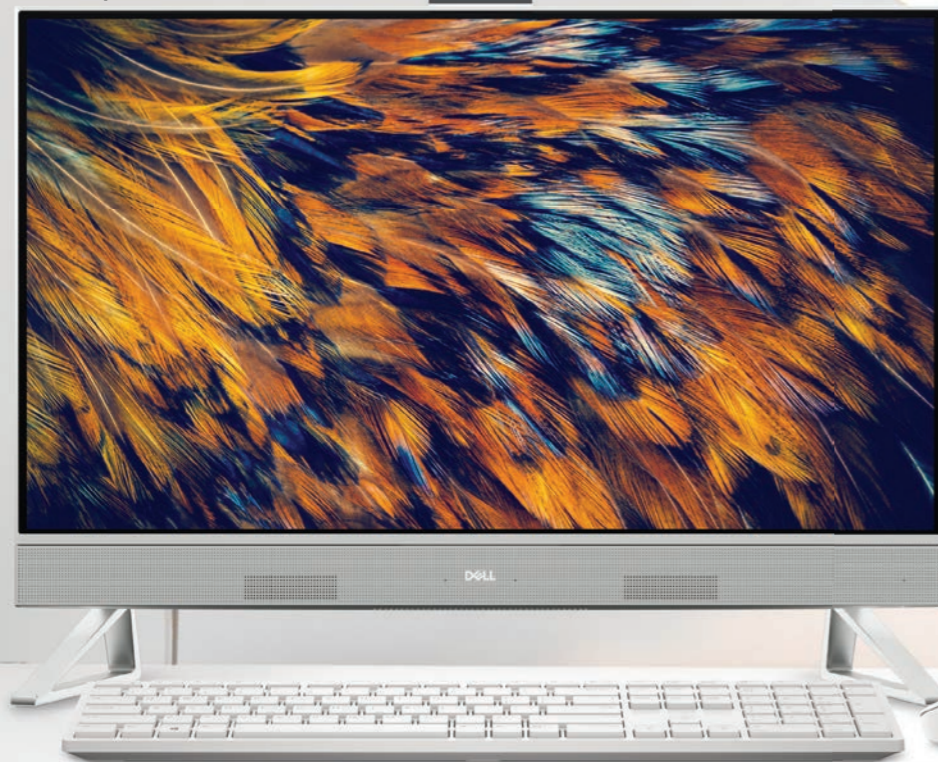
New Inspiron 27 フレームレス デスクトップ