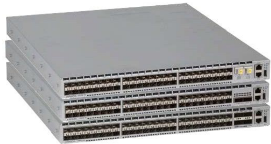
Arista 7280E シリーズ

7280E シリーズは、全モデルがレイヤ 2 とレイヤ 3 の豊富な機能を備え、最大 1.44Tbps のワイヤスピードのパフォーマンスを誇ります。VoQ アーキテクチャと、9GB のウルトラ・ディーブ・パケット・バッファによって、HOL (head of line) ブロッキングを排除します。持続的な輻輳やきわめて高負荷のアプリケーションがある環境でも、ロスレスフォワーディングが可能です。Arista EOS を基盤として、HPC、ビッグデータ、コンテンツ配信、クラウド、仮想化環境にふさわしい、高度な機能を実現します。