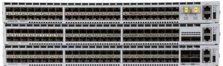
Arista 7280E の柔軟なポート構成

7280SE-64: QSFP+ポート 4 個で、4x40G、16x10G に対応