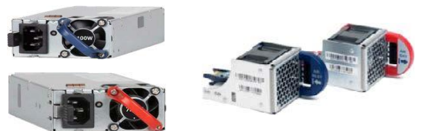
ホット・スワップと反転が可能な電源モジュールとファン・モジュール