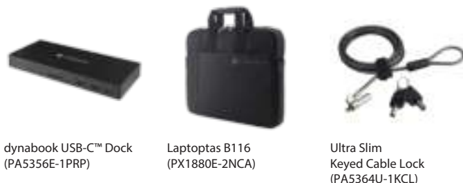
dynabook USB-C™ Dock (PA5356E-1PRP)