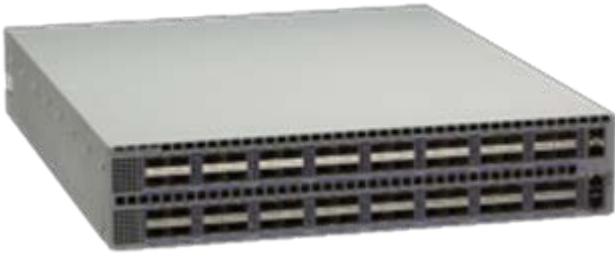
Arista 7260CX-64: 100GbE QSFP100 64 ポート、SFP+ 2 ポート

7260CX-64 は、QSFP100 64 ポートを 2RU システムに収め、ワイヤスピードのパフォーマンスを実現しました。合計スループットは最大 12.8Tbps、レイテンシーは 1500 ナノ秒未満で、64MB のバッファをインターフェイスのグループ間で共有しています。各 QSFP ポートは、100GbE、40GbE、4 × 10GbE、4 × 25GbE、2 × 50GbE という 5 種類の速度をサポートし、最大、10GbE または 25GbE を 256 ポート、および 50GbE を 128 ポートまで柔軟に組み合わせて利用できます。すべてのポートは、どのモードでも制限なく利用できますので、移行も簡単で、柔軟性に優れています。