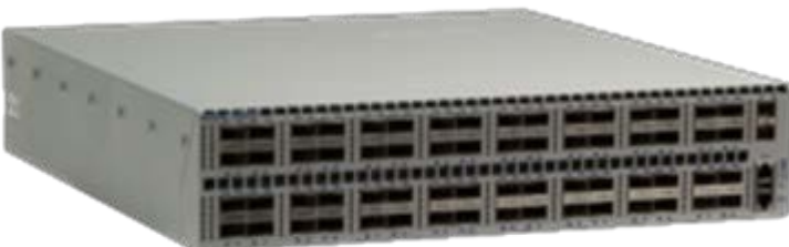
Arista 7260QX-64: 40GbE QSFP+ 64 ポート、SFP+ 2 ポート

7260QX-64 は、40GbE 固定の QSFP+ ポートを 64 ポートを収めた 2RU システムで、電力効率に優れています。合計スループットは 5.12Tbps で、レイヤ 2 とレイヤ 3 のパケット処理能力は最大 3.3Bpps です。