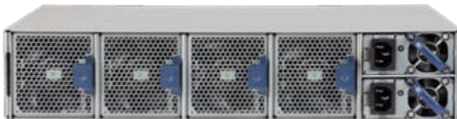
Arista 7260X 2RU の背面: 背面吸気/前面排気のエアフロー(青)