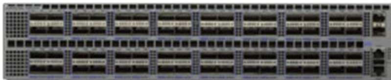
Arista 7260CX-64: 100GbE QSFP100 64 ポート、SFP+ 2 ポート

7060X シリーズと 7260X シリーズは、Arista EOS のパワーを生かして、クラウド、ビッグデータ、仮想化データセンター、物理データセンターの運用に適した高度な機能を提供します。