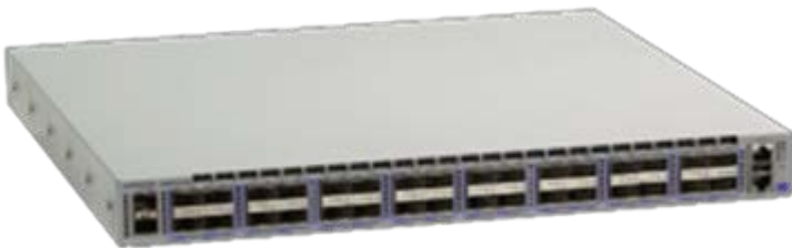
Arista 7060CX-32S: 100GbE QSFP100 32 ポート、SFP+ 2 ポート

7060CX2-32S および 7060CX-32S は、32 ポートの QSFP100 ポートを収めた 1RU システムで、合計スループットは 6.4Tbps です。各ポートは、100GbE、40GbE、4 × 10GbE、4 × 25GbE、2 × 50GbE という 5 種類の速度をサポートし、QSFP の多彩なトランシーバーとケーブルに対応しています。すべてのポートは、どのモードでも制限なく利用でき、トップ・オブ・ラックとスパインのどちらの環境でも柔軟な構成で導入できます。カットスルー・モードでのレイテンシーは最小 450 ナノ秒です。7060CX-32S の共有パケット・バッファ・プールは 16MB で、ポートが輻輳した場合に動的に割り当てられます。また 7060CX2-32S は IEEE 標準に準拠した 25GbE をサポートし、22MB の共有パケット・バッファを有します。レイテンシーは同様に 450 ナノ秒です。