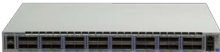
Arista 7060CX2-32S: 40/100GbE QSFP100 32 ポート、SFP+ 2 ポート