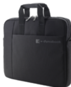
Laptoptas B116 (PX1880E-2NCA)