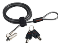
Ultra Slim Keyed Cable Lock (PA5364U-1KCL)