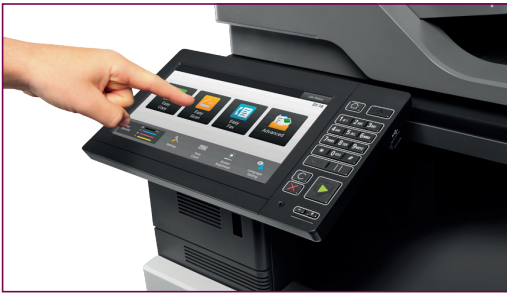
Galardonada interfaz de usuario de Sharp, diseñada para hacerle la vida más fácil.

Nuestros dispositivos incorporan un panel de control LCD táctil con la galardonada interfaz Easy UI* de Sharp, que proporciona un pantalla intuitiva y funciones de uso común de fácil acceso. También puede personalizarla para adaptarla a su forma de trabajar de forma sencilla arrastrando y depositando iconos de menú.