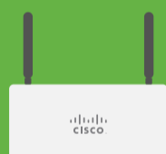
Cisco Meraki MX67 路由器