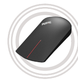
Ratón táctil inalámbrico para ThinkPad® X1