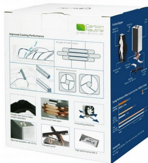
Удобная система крепления и MX-4 в комплекте