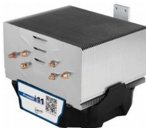
Arctic Freezer i11 получил три двусторонних трубки с прямым контактом