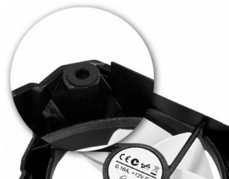
Прорезиненные крепления вентилятора поглощают вибрации