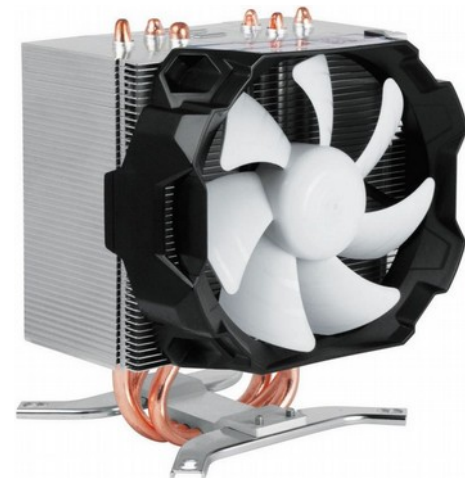
Arctic Freezer i11

Модель Freezer i11 швейцарской компании Arctic предназначена для охлаждения центральных процессоров Intel. Этот достаточно мощный, но относительно небольшой и доступный процессорный кулер укомплектован 92-мм вентилятором с фирменной системой поглощения вибраций. Таким образом, даже при высокой скорости вращения лопастей шум от работы Freezer i11 будет практически не заметен. Для более эффективного отведения тепла внушительный радиатор устройства «связан» тремя двусторонними трубками с прямым контактом к охлаждаемой поверхности. Установка Arctic Freezer i11 не доставит проблем благодаря простому и надежному креплению.