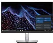
Dell プロフェッショナルシリーズ P2422H 23.8 インチ ワイドモニター

ComfortView Plus で常時眼に優しく、3 辺極細ベゼルを採用。あらゆる業種に最適な 23.8 インチ ビジネス用 スタンダードモニターです。