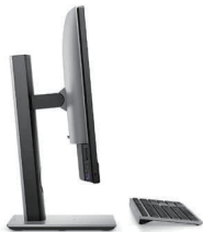
OptiPlex All-in-One 高さ調整可能スタンド

このインテリジェントな Microsoft Teams 認証サウンドバーで、クリアな会議とバックグラウンドノイズの低減を体験してください。