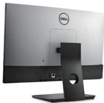
高さ調節可能スタンドに統合された OptiPlex All-in-One DVD+/-RW

高さ、前後 / 左右の角度、縦横の回転で All-In-One を最も見やすい位置に調整できます。