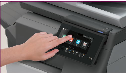
Cenami overené používateľské rozhranie Sharp – navrhnuté pre jednoduchší život

Naše zariadenia sú vybavené LCD dotykovým panelom s oceňovaným používateľským rozhraním Sharp*, ktoré prináša intuitívny displej a jednoduchý prístup k bežne používaným funkciám. Prípadne si ho môžete prispôsobiť presunutím požadovaných ikon z ponuky tak, aby vyhovoval vašim potrebám.