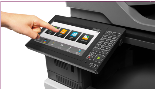
Sharpin palkittu käyttöliittymä - kehitetty helpottamaan elämää.

Sharpin laitteissa on LCD-pyyhkäisy näytöllä varustettu käyttöpaneeli sekä palkittu helppokäyttöliittymä*, jonka avulla luot intuitiivisen näytön ja saat helposti käyttöösi yleisimmät toiminnot. Voit myös räätälöidä käyttöpaneelin omaan toimintatapaasi sopivaksi valikon kuvakkeita vetämällä ja pudottamalla.