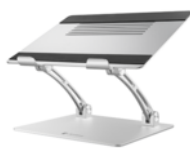
Verstellbarer Notebook-Standfuß (PS0106EA1STA)